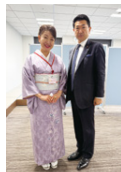
あかま二郎防災担当大臣と豊田会頭