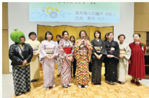
女性会は着物の装いで活動をPR