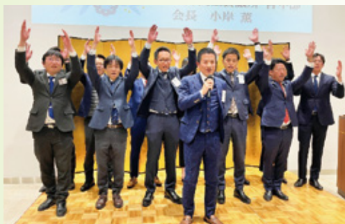
青年部のPRと万歳三唱