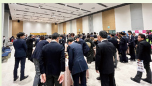
会場内は相互交流の熱気に包まれました